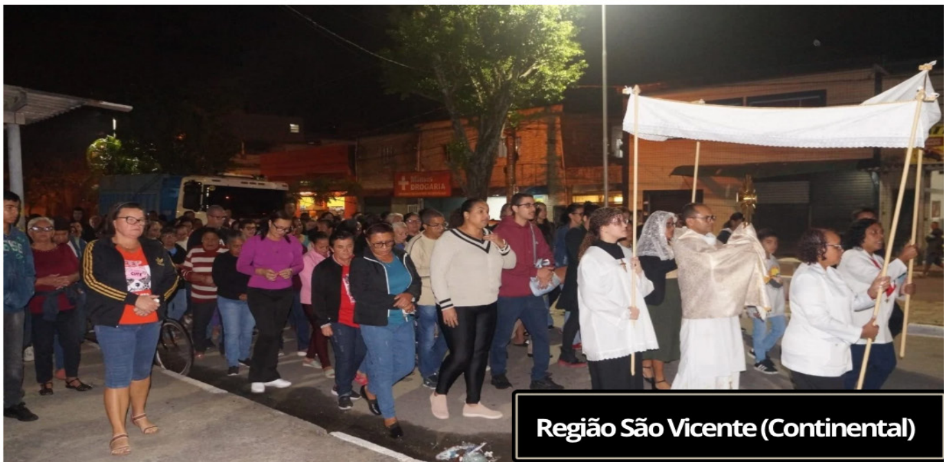
Região São Vicente (Continental)